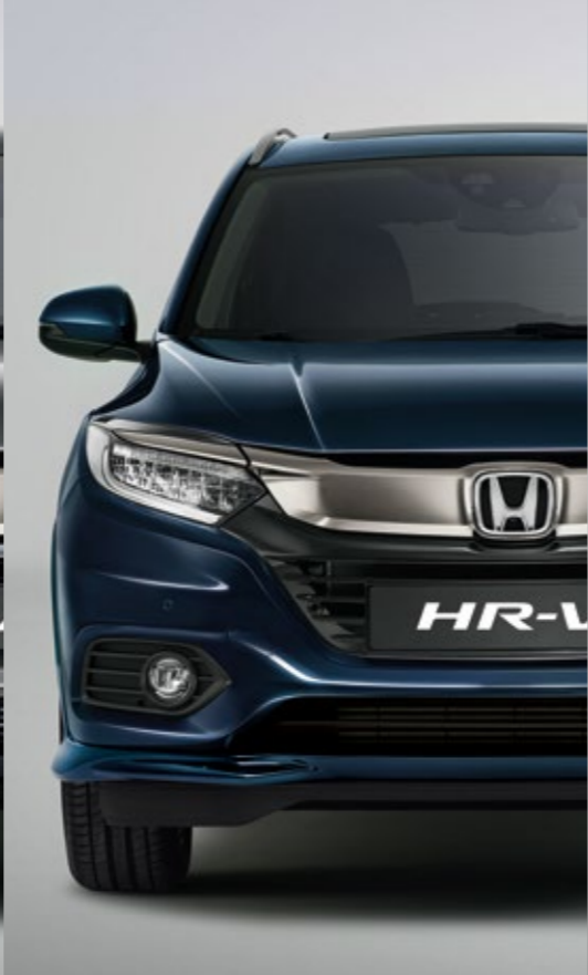
METALICKÁ MIDNIGHT BLUE BEAM