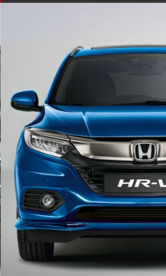
METALICKÁ BRILLIANT SPORTY BLUE