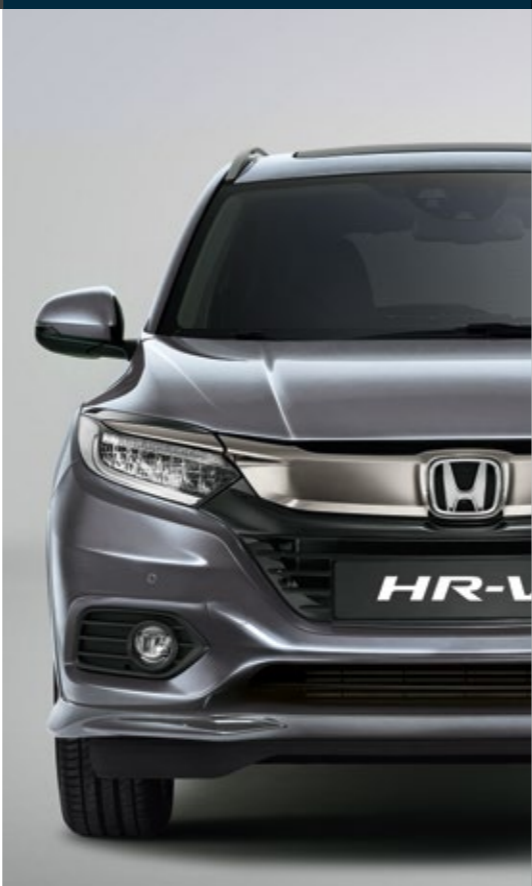
METALICKÁ LUNAR SILVER

Vybrať si môžete z farieb, ktoré vyzerajú tak dobre, ako znejú. Od metalickej Midnight Blue Beam až po Rally Red – vyberte si tú, ktorá sa najlepšie hodí k vašej osobnosti.