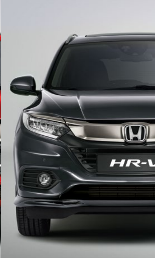
METALICKÁ MODERN STEEL