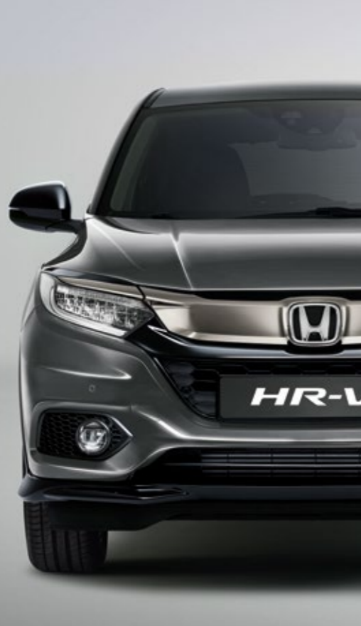
METALICKÁ PLATINUM GREY*