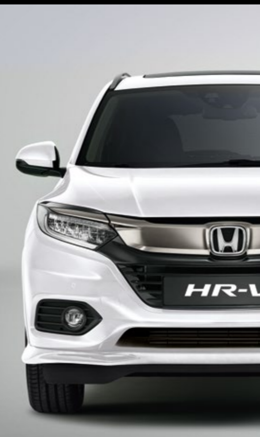
PERLEŤOVÁ PLATINUM WHITE