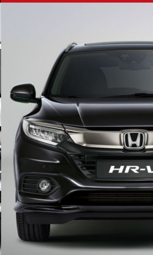
METALICKÁ RUSE BLACK