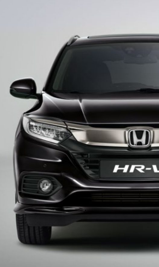
PERLEŤOVÁ CRYSTAL BLACK